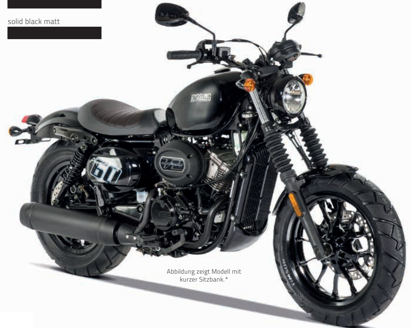
Abbildung zeigt Modell mit kurzer Sitzbank.*