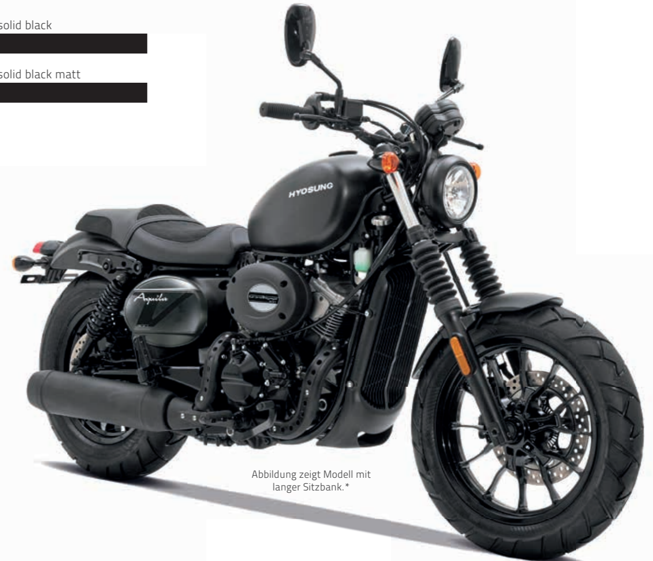
Abbildung zeigt Modell mit langer Sitzbank.*