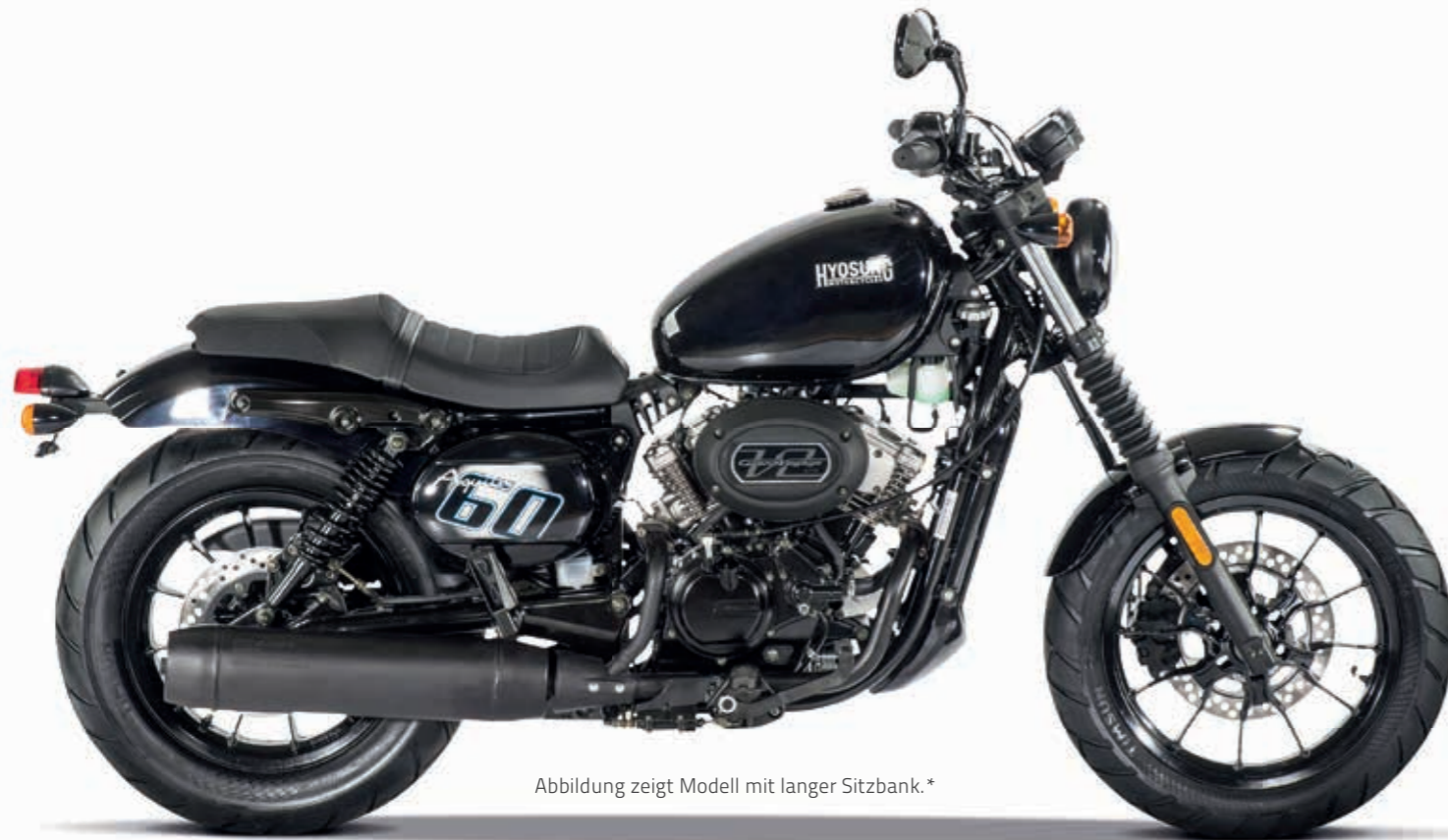
Abbildung zeigt Modell mit langer Sitzbank.*