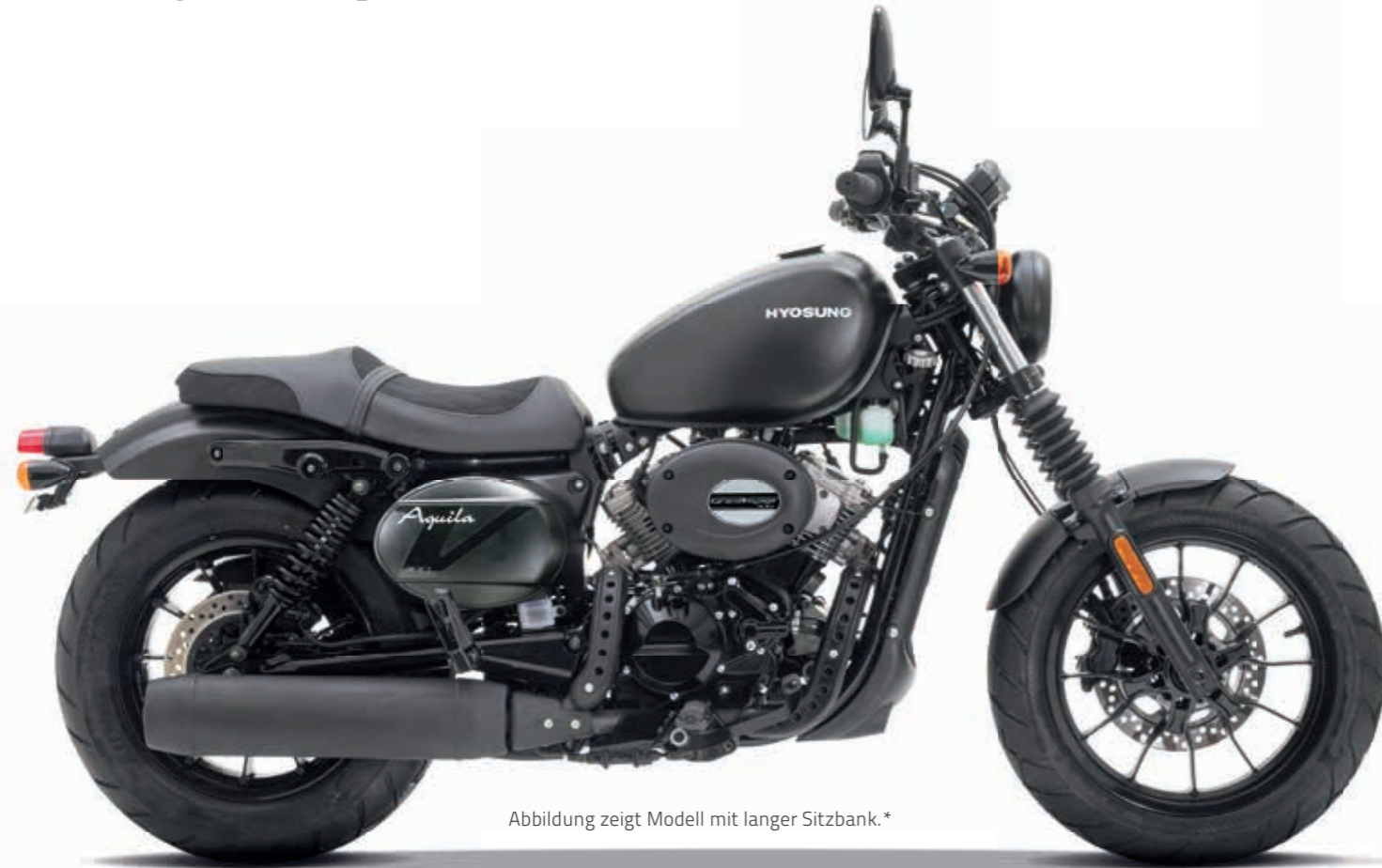
Abbildung zeigt Modell mit langer Sitzbank.*

Lässige Retro Optik trifft moderne Technik!