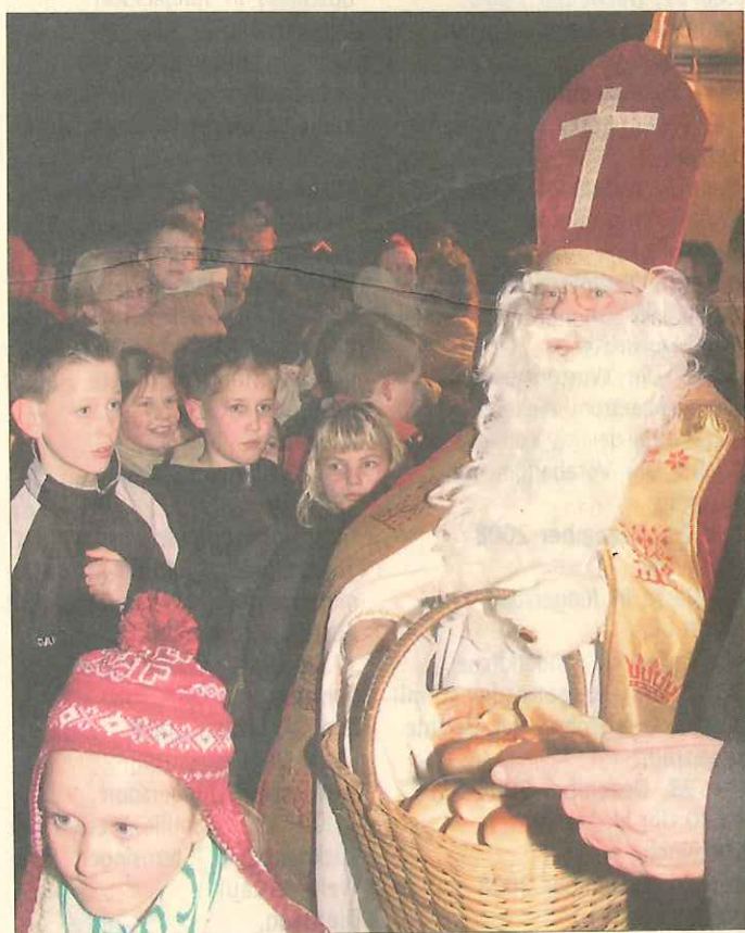
Der Weihnachtsmann wir die kleinen Gäste in Merode überraschen

Das obligatorische Feuer wird die Gäste äußerlich wärmen. Innerliche Wärme gibt der bekannt gute Glühwein. Erst am 4. Advent wird er frisch zubereitet. Für die kleinen Gäste wird ein heißer Kakao angeboten. Auch dem Weihnachtsmann hat die BVM geschrieben und um seinen Besuch gebeten. Bisher ist er auch immer gekommen, hat einige wohl gewählte Worte an die Gäste und die BVM gerichtet und den kleinen Besuchern ein Geschenk mitgebracht.